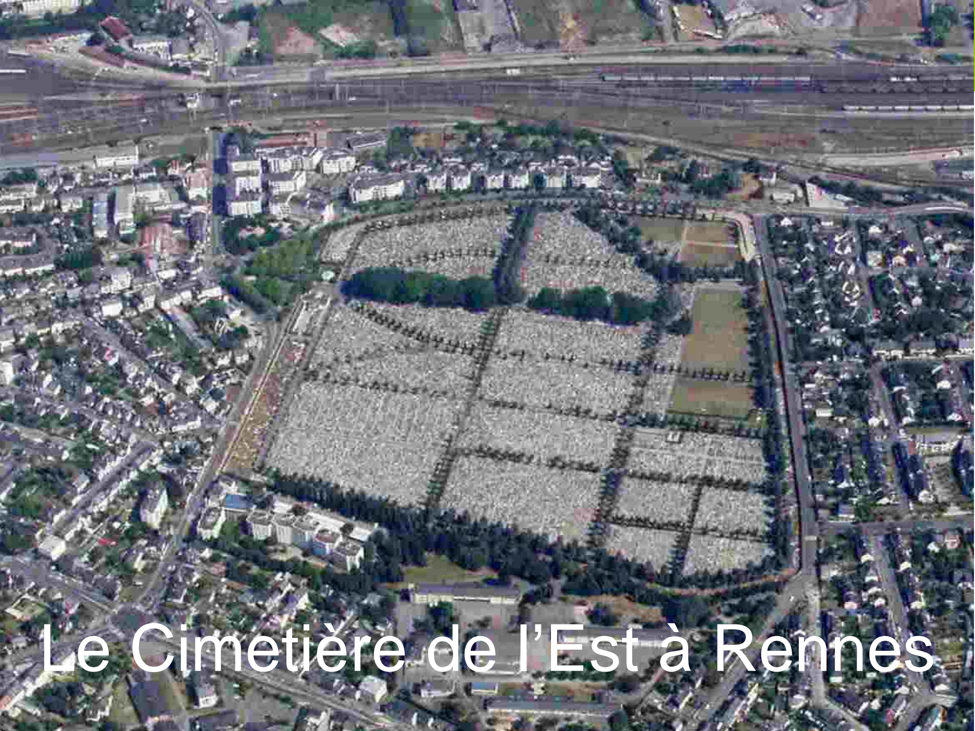
Le Cimetière de l'Est à Rennes