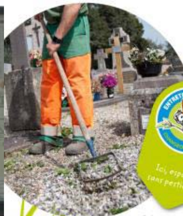
Retrouvez ce panneau sur les lieux d'expérimentation