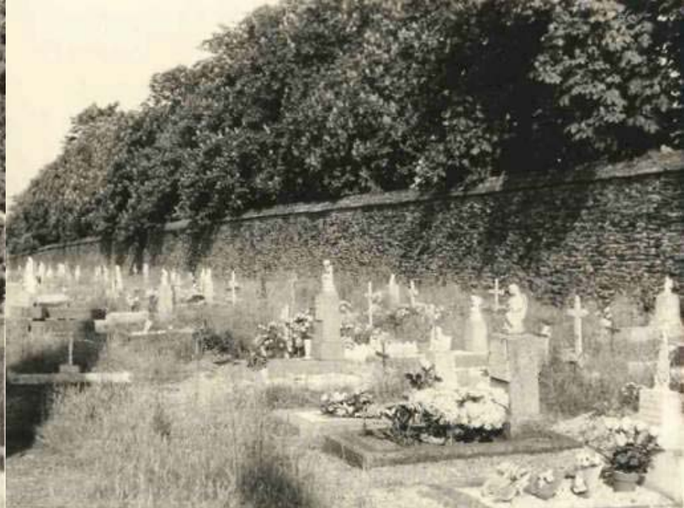
CIMETIERE DE L'EST Années 1970