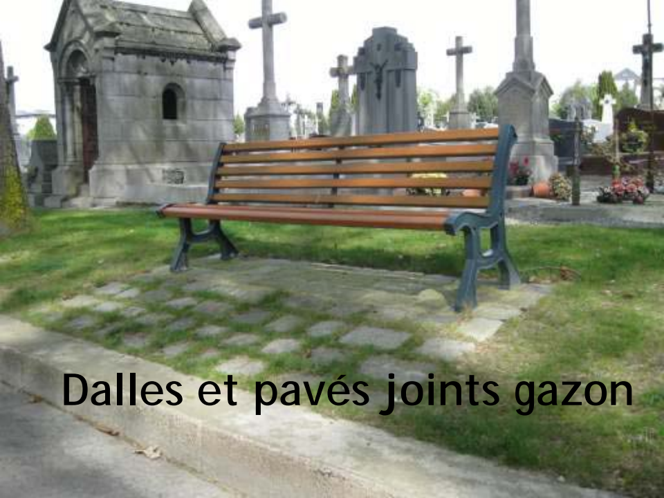
Dalles et pavés joints gazon