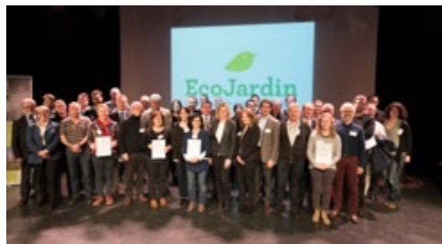
Remise des certificats de labellisation le 30 janvier 2017 à Paris par Barbara Pompili, secrétaire d'Etat chargée de la Biodiversité

Une rencontre annuelle pour échanger entre professionnels