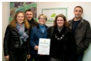
Remise du certificat de labellisation pour 4 sites à la ville de Versailles en 2014