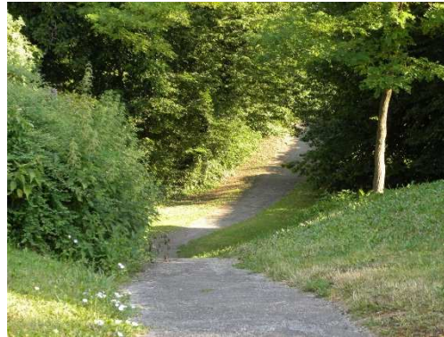
La coulée verte de la combe Saragosse