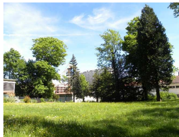
- le square de Fontaine Ecu : ancienne propriété privée