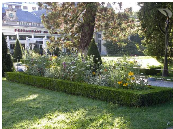
Les jardins du Casino