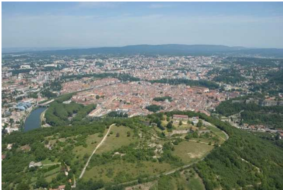
Les espaces naturels des collines