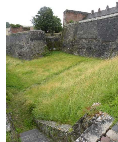
Les espaces verts de la Citadelle