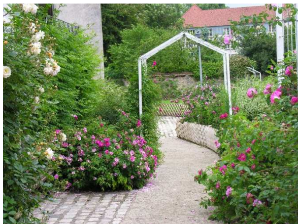
- le clos Barbizier : roseraie avec des variétés de roses anciennes