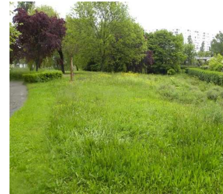
Les espaces verts d'accompagnement Cerisier - Planoise