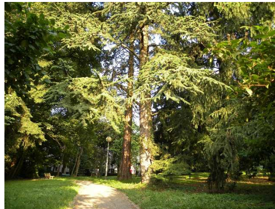
Le jardin public des Chaprais