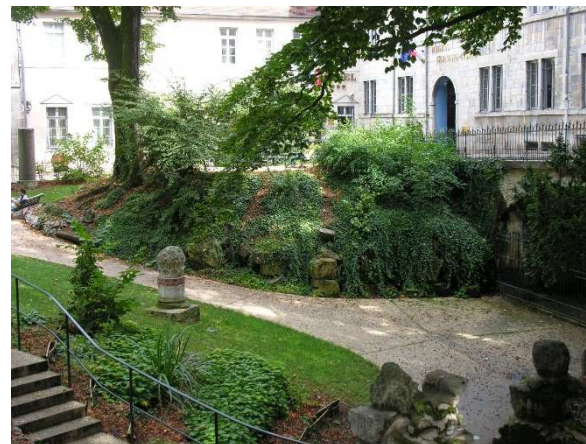
- le square archéologique Castan : square original au pied de la Citadelle