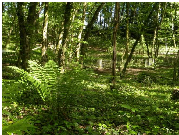
- la combe Boichard : espace naturel en ville