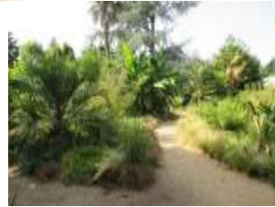
Orangerie et serres