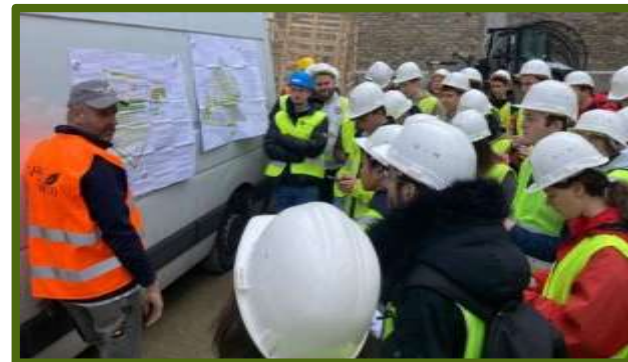
Visite du parc de la Reine Margot (Rueil-Malmaison) au BTS Aménagements Paysagers du Lycée agricole de Saint Germain en Laye