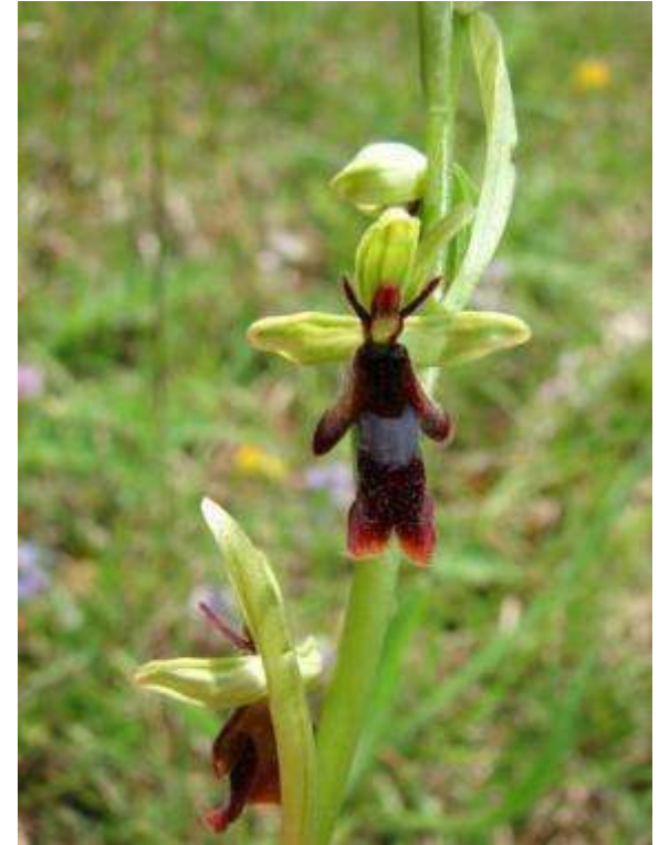
OPHRYS insectifera Ophrys mouche