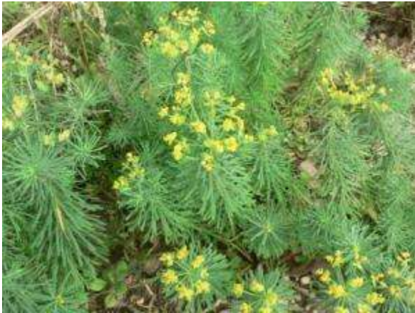
EUPHORBIA cyparissias Euphorbe petit cyprès