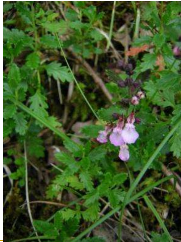
TEUCRIUM chamaedrys Germandrée petit chêne