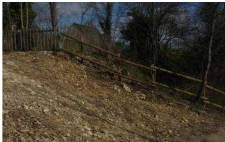
Essai de suppression de la couche de terre végétale. 2008