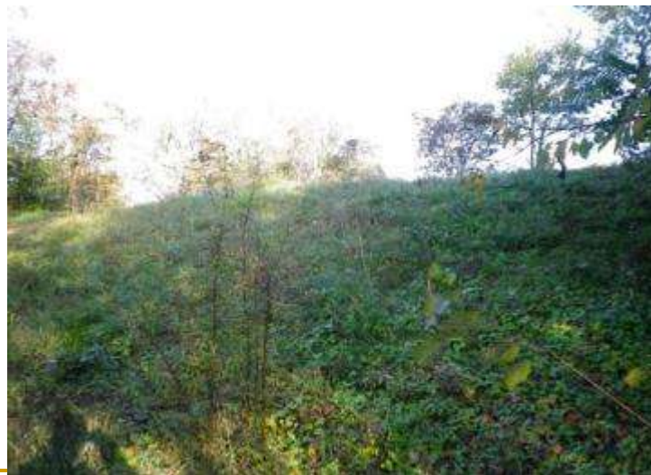
Même zone en 2014