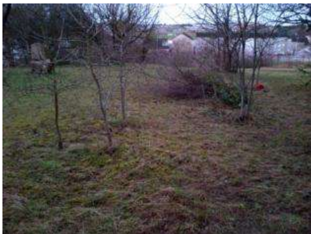
Evacuation systématique des déchets verts sur la pelouse calcaire