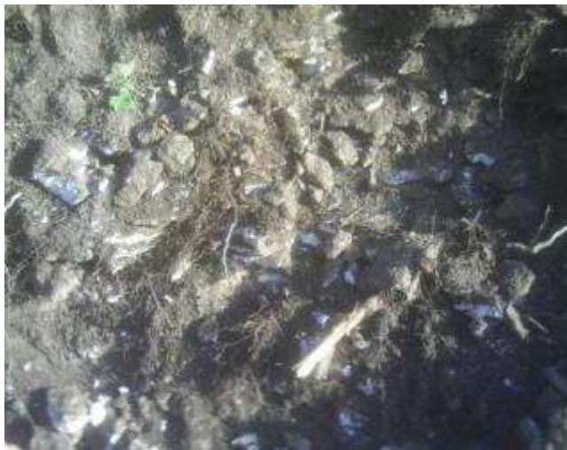
Sol en place